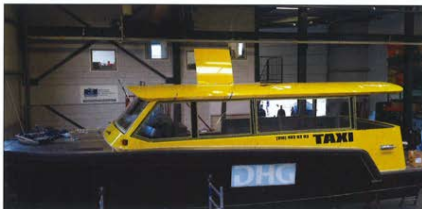
Die Wassertaxis von Alumax Boats sind so gebaut, dass sie seewasserfest sind. Der Rumpf besteht aus seewasserfestem Aluminium.

Germeraad: „Watertaxi Rotterdam pendelt auf dem am dichtesten befahrenen Flussabschnitt von ganz Europa mit kleinen Booten