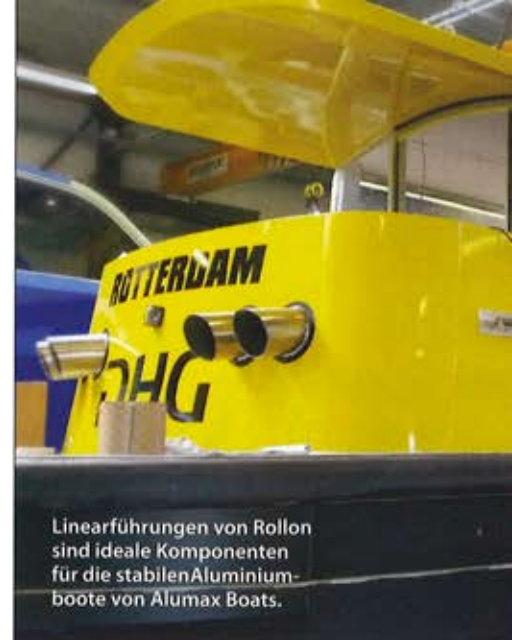
Linearführungen von Rollon sind ideale Komponenten für die stabilen Aluminiumboote von Alumax Boats.

Alumax Boats hat einen vielfältigen Kundenstamm und baut sowohl Boote für Privatkunden als auch für den gewerblichen Einsatz. Ein Beispiel ist das Muschelfischerboot, ein 24 m langes Boot mit flachem Boden. Dieses Boot ist speziell dazu entwickelt worden, im flachen Wasser Muscheln zu ernten, ohne dass die Gefahr besteht, aufzulaufen. Ein anderes Beispiel ist das 10 m lange Rundfahrtboot für die Grachten in Utrecht. Dieses Boot wird über einen Saildrive-Motor von Krätler mit einer Leistung von 10 kW vollelektrisch angetrieben. „Wir durften auch 17 Taxiboote für die Olympischen Spiele in London bauen. Das war ein besonders tolles Projekt“, sagte Germeraad. Alumax Boats entwirft und baut die Boote